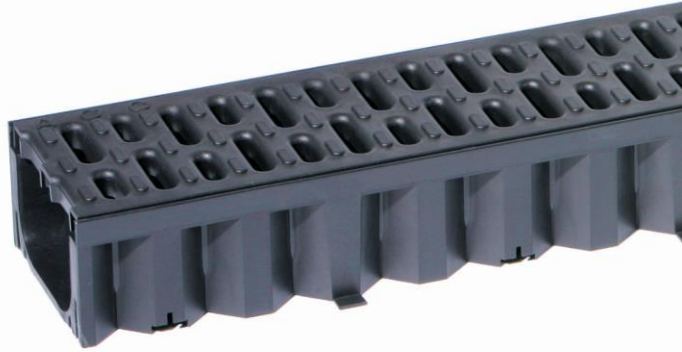
Канал ACO Hexaline композитный с решеткой КОМПОЗИТ L=1м. Н=7,9 см Розница 550 руб.